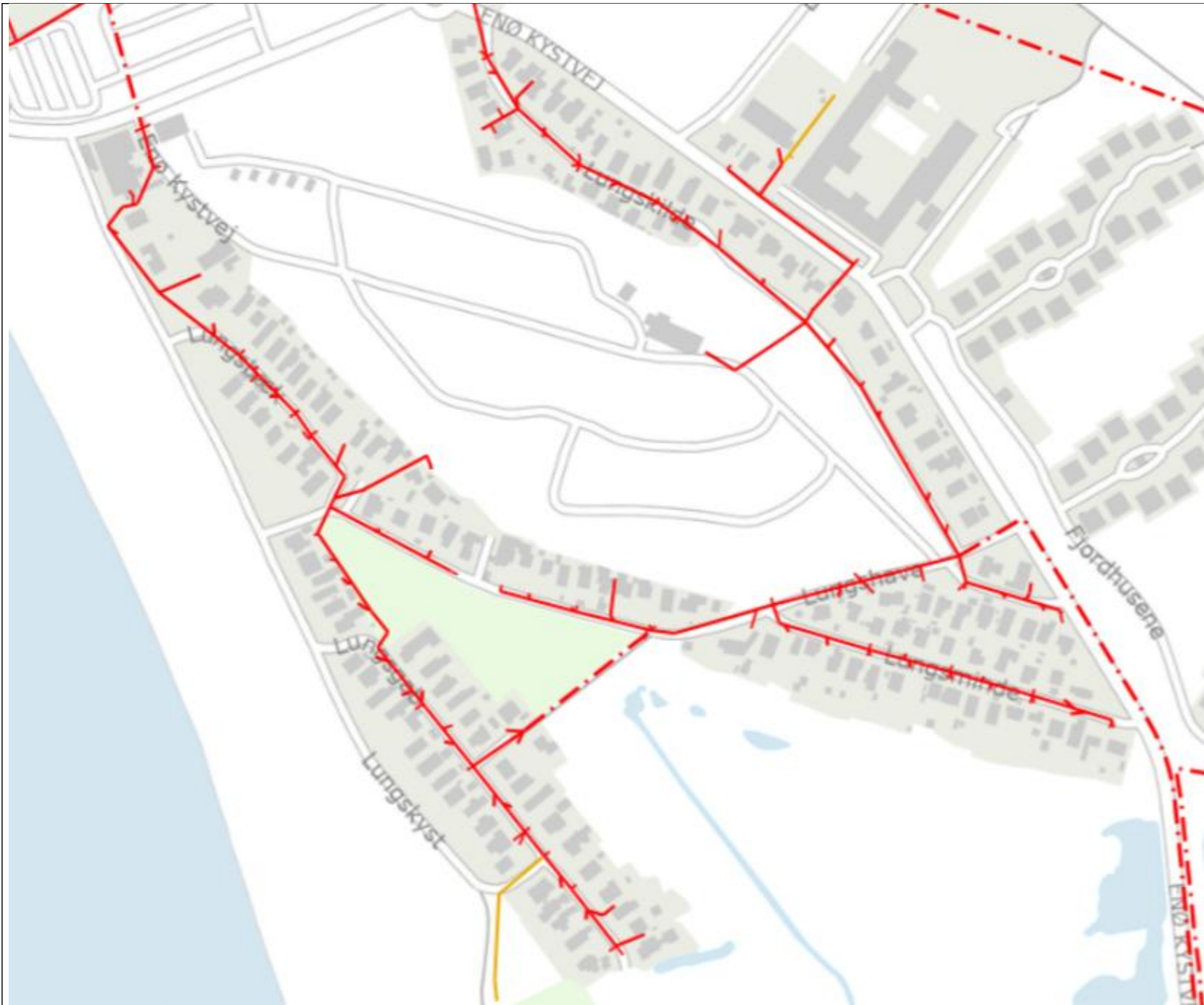
Kloak ledninger Lungshave